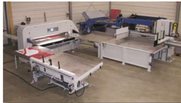
E-line 260 en un sistema de corte: El sistema de corte con dos mesas largas de transferencia, vibrador y re-apilador.