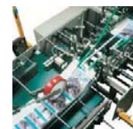
Entrega y banda motorizada